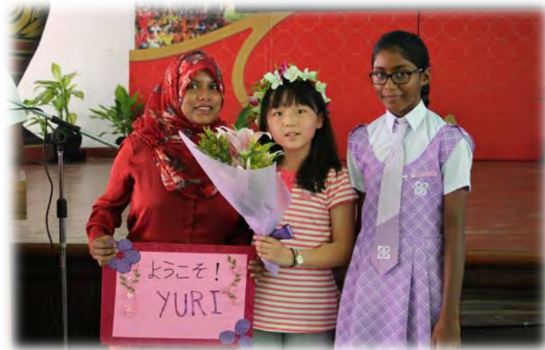
モルディブ：ホストファミリーと対面