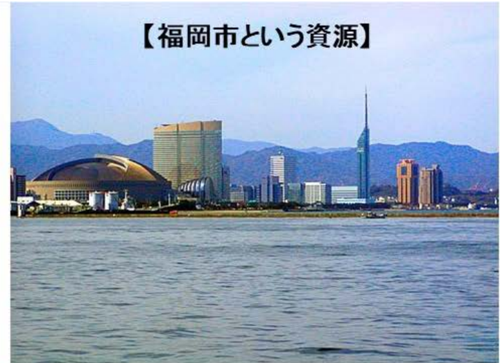
【福岡市という資源】