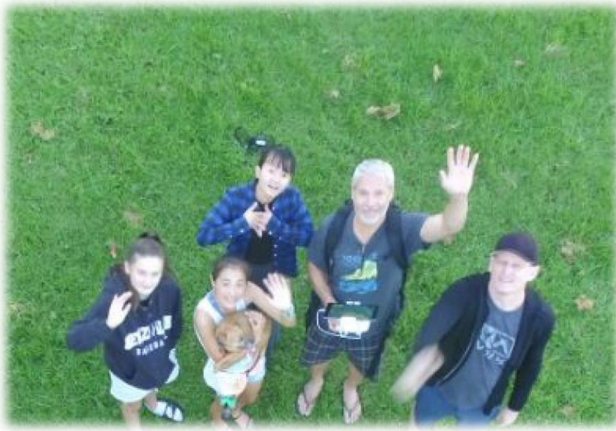
ニュージーランドのホストファミリー