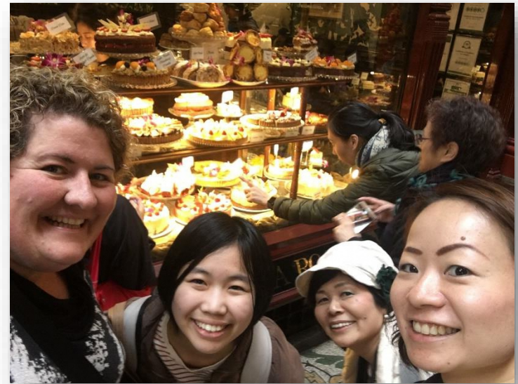
オーストラリア：こども大使OGとも対面