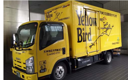
天神地区共同輸送(株)の「イエローバード」で実証