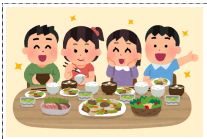
子どもたちのスペース（その他フードパントリーの様子が見えるもの）