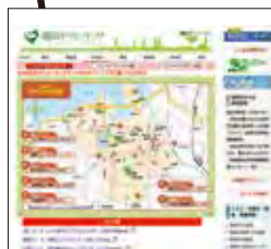
中央区ウォーキングマップ