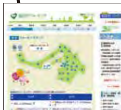
東区ウォーキングマップ