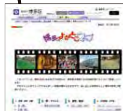
博多んよかとこマップ