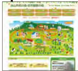
油山市民の森・自然観察会の森