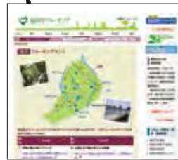
南区ウォーキングマップ