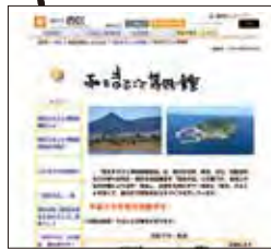
西区まるごと博物館