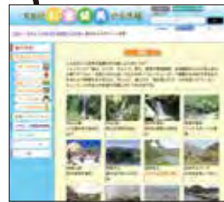
早良区彩食健美の玉手箱

癒しのスポット満載の早良区。豊かな自然とのふれあいで心と体をリフレッシュしよう!