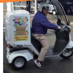
商店街による高齢者等への宅配・見守り事業