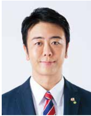
令和3年6月1日 福岡市長 高島 宗一郎

福岡市は、歴史や文化、豊かな自然と充実した都市機能を有する、住みやすく働きやすいまちです。この素晴らしいまちを将来へ引き継ぐため、「都市の成長」と「生活の質の向上」の好循環を創り出し、福岡市を次のステージへと飛躍させるためのチャレンジを続けています。