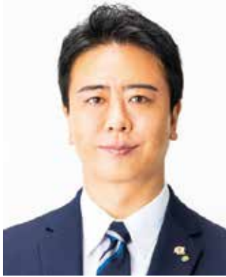
令和5年6月1日 福岡市長 高島 宗一郎

福岡市は、歴史や文化、豊かな自然と充実した都市機能などさまざまな魅力に恵まれた、住みやすく働きやすいまちです。