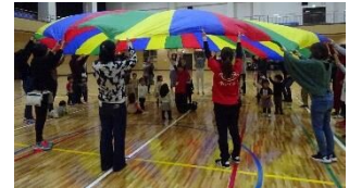
あいくるが やってくる!