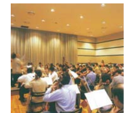
※ 音楽・演劇練習場