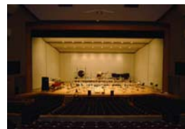
※市民センターホール