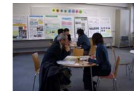
※フリースペース （ボランティア交流センター）