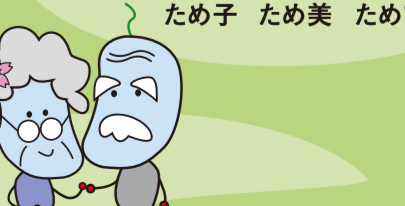
ため蔵の母 ため蔵の祖母 ため蔵の父 ため蔵の祖父 ため蔵の姉 ため蔵の妹 ため蔵の友達 マモちゃん