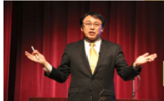
「区民と医師との会」各公民館(認知症に対する啓発)