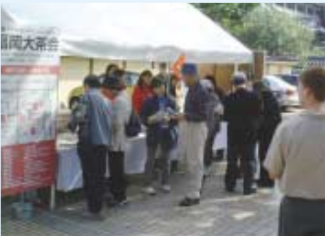
本場でマップをもらってスタート。