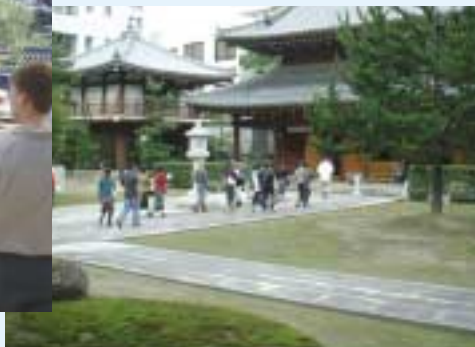
観光ボランティアの案内で見学。(写真は承天寺仏殿)