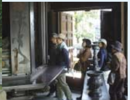
普段は見えないところも拝観。(写真は東長寺六角堂)