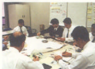
天神地区の意見交換会

福岡市路上違反広告物問題対策協議会 建設省九州地方建設局福岡国道工事事務所、福岡警察署、九州電力株式会社福岡支店、日本電信電話株式会社NTT福岡支店、福岡印刷工業協同組合、福岡市広告美術業協同組合、福岡市（土木局、都市整備局）で構成。