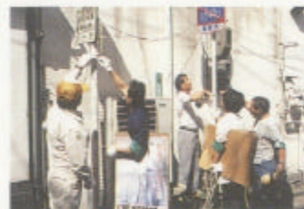
モデル地区 住民による除却活動

などの向上の面からも屋外広告物の在り方について、見直そうといった考えが広く市民意識として根づいていくことが必要ではないかと考えられる。