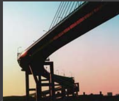
福岡都市高速ラビリンス 菊地 昭彦 荒津大橋