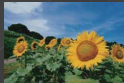
真夏の笑顔 御供田 有里 のこのしまアイランドパーク お花畑