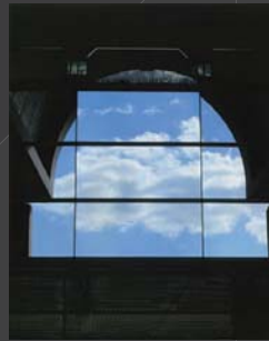
空 橋口 勝吉 福岡市博物館