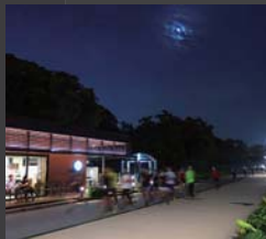
月と星と駆ける 中村 善輝 スターバックスコーヒー 福岡大濠公園店