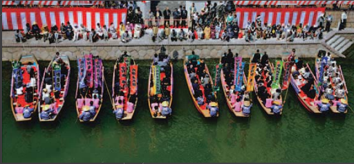
船乗り込み 石村 國男 船乗り込み