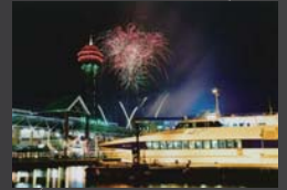
サマーナイト フェスティバル 橋本 禎寛 ベイサイドプレイス博多埠頭