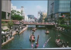
船乗り込み 善生 喜久 船乗り込み