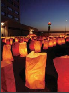
灯火が広がる先 仲間 理美 博多灯明ウォッチング