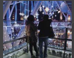
ファンタスティック ナイト 山本 和弘 J R博多シティ