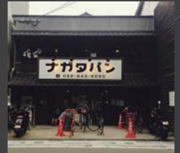
混在 櫻木 浩子 ナガタバン