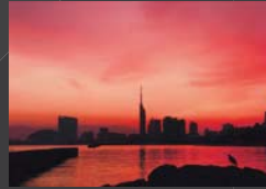
アオサギくんも この眺めをエンジョイ 西久保 民久 福岡タワー