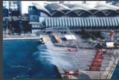
消火訓練 丸山 徳子 ベイサイドプレイス博多埠頭