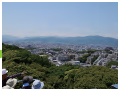
平和南緑地からの眺望！