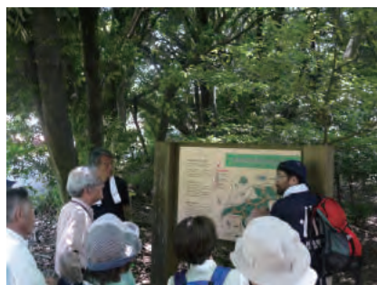
特別緑地保全地区の鴻巣山へ