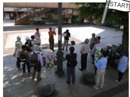
快晴の中、高宮駅に集合！