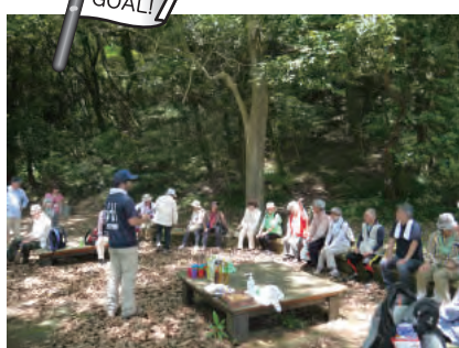
木陰スポットで振り返り