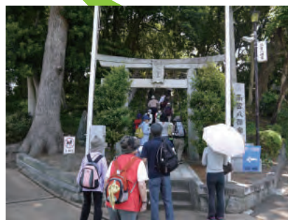
高宮八幡宮にお参りに