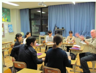
福岡インターナショナルスクールにおける教職員英語教室