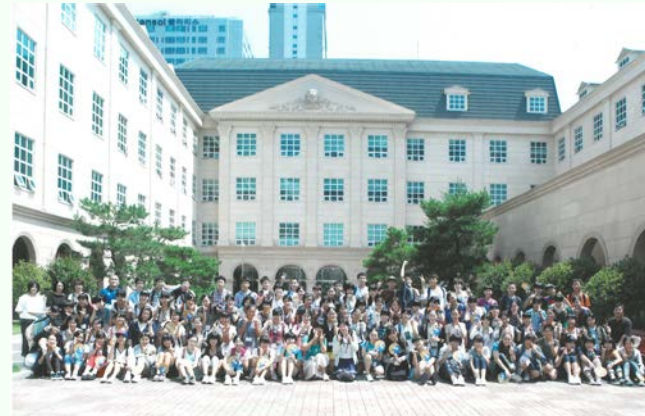
グローバルチャレンジ イン釜山