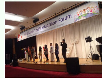
アジアユース教育フォーラム