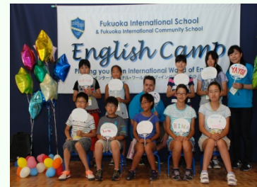
留学体験インモモチ