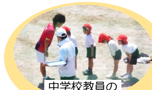
中学校教員の 専科指導