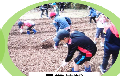
農業体験 タマネギ・みかん