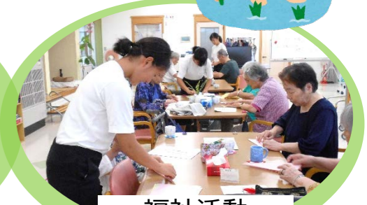
福祉活動 みんなの家清和園