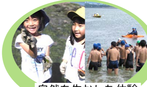
自然を生かした体験 磯遊び・遠泳