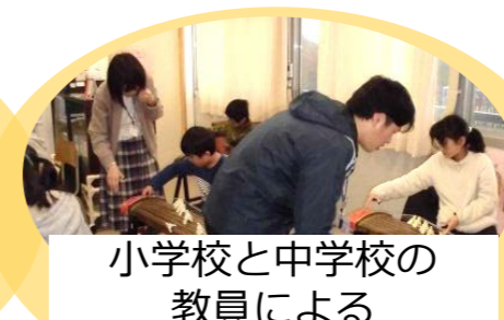
小学校と中学校の 教員による チームティーチング