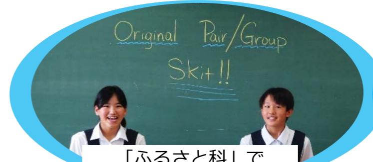
「ふるさと科」で 学んだことを英語で発信