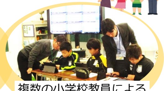
複数の小学校教員による チームティーチング