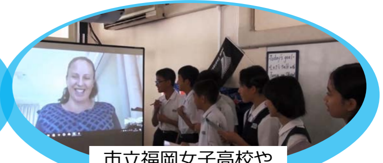
市立福岡女子高校や 海外の学校と交流活動