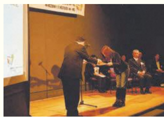
アート展表彰式(昨年)

城南区役所 〒814-0192城南区鳥飼六丁目1-1 代表電話 ☎822-2131 ☎822-2142