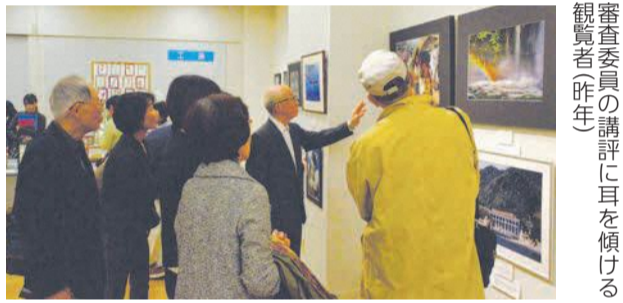
審査委員の講評に耳を傾ける観覧者(昨年)

ふれあい城南運営委員会事務局(区企画共創課内) ☎833・4053 ☎844・1204