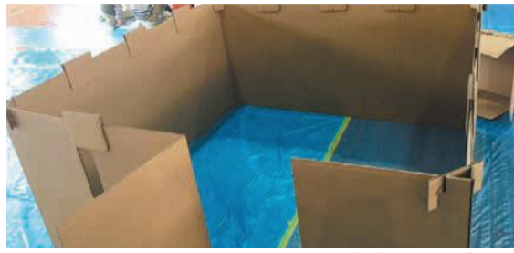
段ボールでパーソナルスペースを確保(別府校区)

別府小学校で行われた訓練に、地域住民ら約130人が参加しました。今回は、一人で避難することが困難な人に対しての安否確認の方法や、避難所までの安全な経路の確認を重点的に行いました。