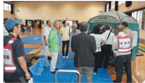
防災倉庫用品の点検(城南校区)