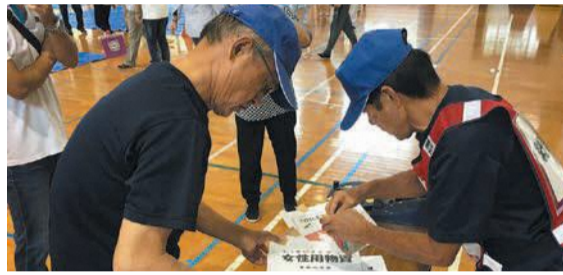
避難所の設置訓練(城南校区)

城南公民館と城南校区自治協議会等が中心となって「安全安心まちづくり講座」を全3回にわたり実施しました。「避難所を設置・運営していくためには」という観点から講義等で防災に関する知識を深めました。