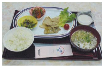
昨年のヘルシーランチ

詳しくは区役所や公民館等で配布するリーフレットまたは区ホームページ(第32回 城南区さわやか健康フェア)で検索をご覧ください。