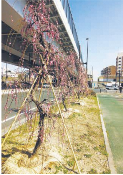
美しいしだれ梅が咲きました(昨年)

活動のきっかけは、夜間パトロールの時の「この町は梅林といふのに梅の木が少ない」という参加者の何気ない一言でした。「それならみんな梅を植えよう」との提案に有志が賛同し、プロジェクトが発足。地域住民や企業の協力を得て、今年12月に8本のしだれ梅を植樹し、昨年2月に美しい花が咲きました。昨年12月には梅林中学校の生徒も参加して、町内の雑草地や公園、道路などに新たに計26本のしだれ梅を植樹しました。