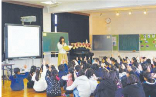
税金にまつわるクイズに答える児童たち

学校の黒板や机など、身近なところで使われている税金の額について区職員が説明を行うと、児童からは驚きの声が上がりました。税金をテーマにしたアニメも上映され、消防やごみ収集、道路や公園など普段当たり前利用しているものが、税金で成り立っていることを学びました。