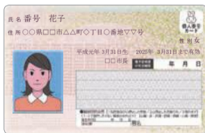
マイナンバーカード(見本)

マイナンバーカードがあれば、上記の証明書をコンビニでも取得できます(福岡市発行のものに限る)。コンビニでの