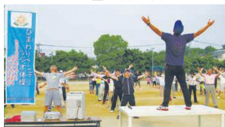
朝から元気に体を動かします

同ラジオ体操は自由に参加できる城南校区の一押しイベントです。毎週開催していますので気軽に体験してみませんか。☎毎週日曜日午前8時~(約15分)☒城南小学校グラウンド ※雨天時は体育館☒同校区自治協議会 ☎843-9418 ☒843-8693☒無料☒不要