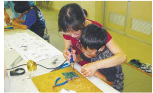
慣れない作業に真剣に取り組む参加者