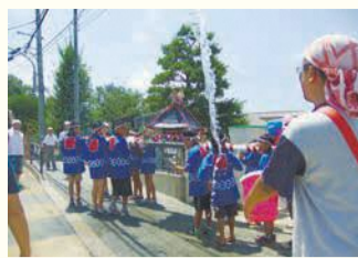
長尾校区「こどもみこし」

城南区役所 〒814-0192城南区鳥飼六丁目1-1 代表電話 ☎822-2131 ☎822-2142