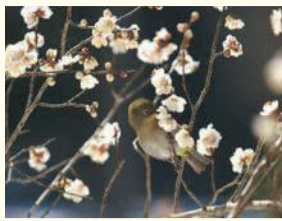
油山に咲く梅とメジロ