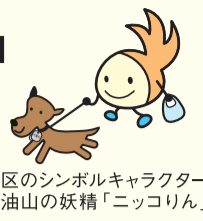
区のシンボルキャラクター 油山の妖精「ニッコりん」

〒814-0192 城南区鳥飼六丁目1-1 窓口受付時間:午前8時45分~午後5時15分 (土日・祝日・年末年始を除く) 区ホームページは「福岡市城南区」で検索