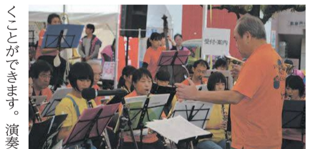
真。この演舞台での演奏

がきっかけで長尾公民館から依頼を受け、昨年初めて同公民館で音楽会を開催しました。