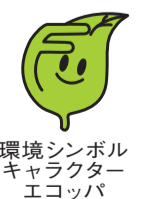
環境シンボルキャラクター エコッパ

「もったいない」の気持ちを持って、食品ロスを減らすためにできることから始めてみませんか。