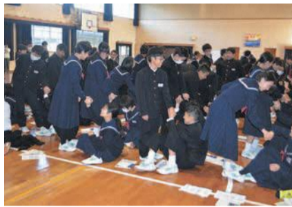
お知らせ・参加者募集

続いて、ユマニチュード講座ではエクササイズやゲームのスタンプとユマニチュード認定インストラクターの先生から、ユマニチュードの重要性やユマニチュードの活用方法について学びました。