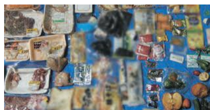
手つかずのまま廃棄された食品

●「賞味期限」と消費期限の違いを理解する 「賞味期限」はおいしく食べることができきる期 ●「賞味期限」と消費期限の 捨ててしまいがちな野菜の皮なども、きんぴらやみそ汁の具などに上手に使用すれば栄養も取れ、無駄になりません。 ●「外食のときは」 食べ切れる量だけ注文 ハーフサイズや小盛りなど、適量を注文して食べ切りましょう。 ●問い合わせ先/区生活環境課 ☎833・4087 ☎822・4095