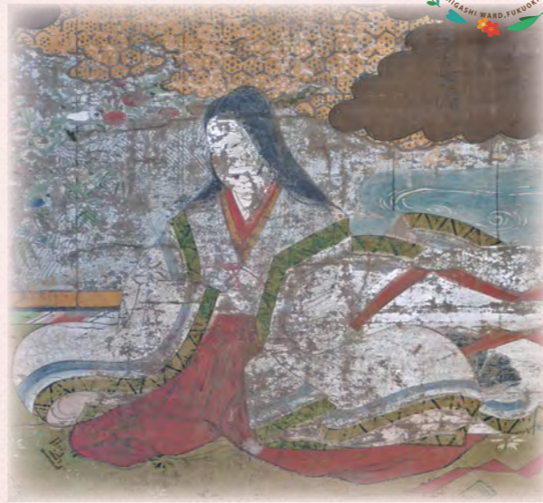
関千代肖像・良清寺蔵

1600年（慶長5年）、関が原の戦いで西軍に味方したために改易となりましたが、1620年（元和6年）、柳川に再度入封して筑後下5郡10万9600石を領地としました。1637年（寛永14年）の島原の乱には、子の忠茂と共に従軍し功をたて、1642年（同19年）江戸にて生涯を閉じました。