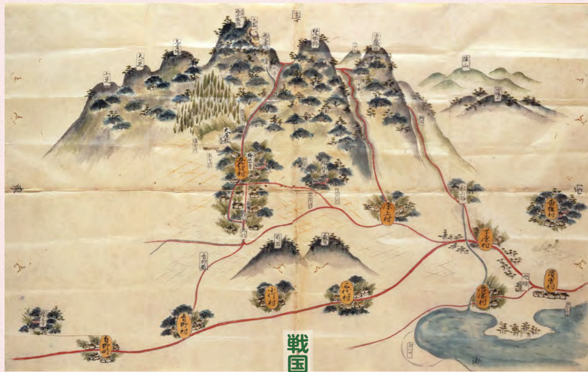
立花山絵図「立花家史料館蔵・柳川古文書館寄託」