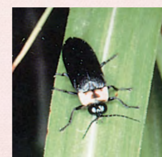
ゲンジボタル（5月下旬～6月）