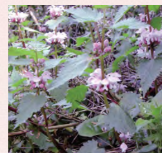
オドリコソウ（2月～5月）