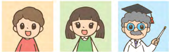
ふく 福さん ひろみ 博美さん はかせ 博士