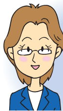
主任ケア マネジャー