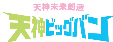
配色を変更しない