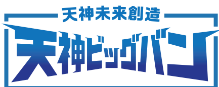
周りに他の要素を配置しない