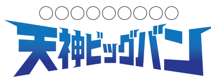
キャッチコピーを変更しない