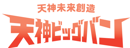
指定カラー以外の色を使用しない