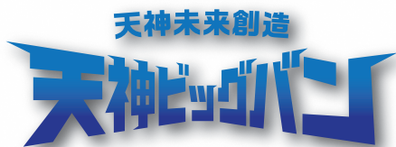
規定以外の影をつけない