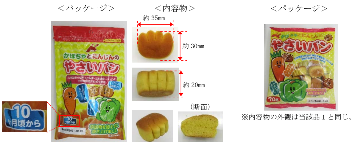
写真1. 当該品1の外観（事例1） (注3)

（注2）「食品表示基準」（平成27年内閣府令第10号）では、「その他のパンのうちパン生地を圧延し、これを切断、成形したものを焼いたものにあつては、『カットパン』と表示することができる」とされています。