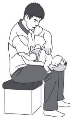
図2. 乳児に対する胸部突き上げ