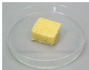
写真4. テストの様子(当該品1)

(注20) 吸収は目視で確認しました。なお、テストは温度20℃、湿度65%の環境で行いました。