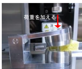
写真5. テストの様子