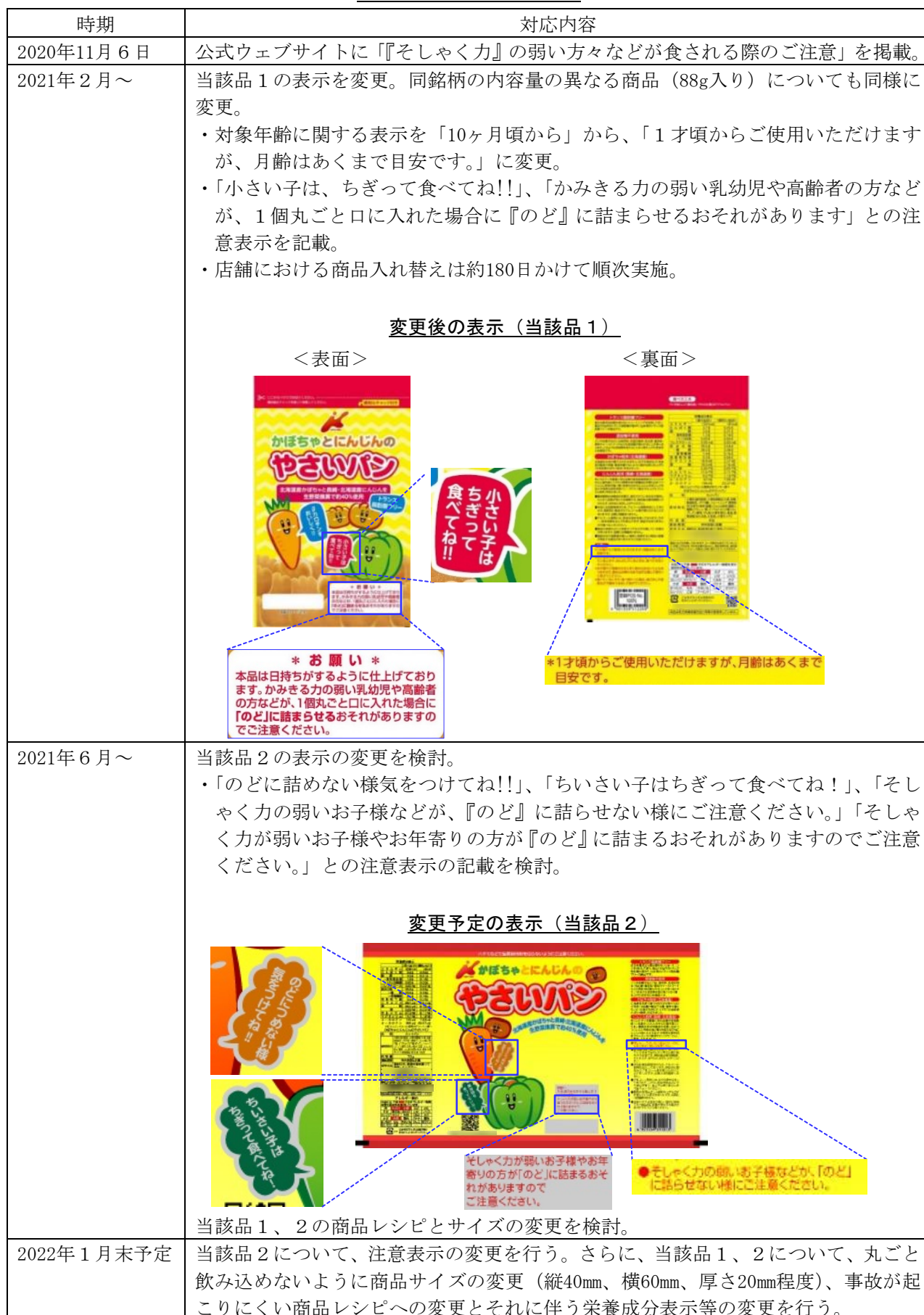
表2. 製造事業者の対応