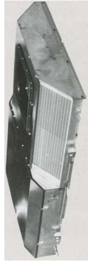
ユニットクーラー