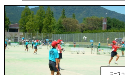
テニスコート利用状況