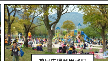
遊具広場利用状況