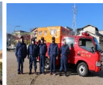
（非常時備える消防自動車）