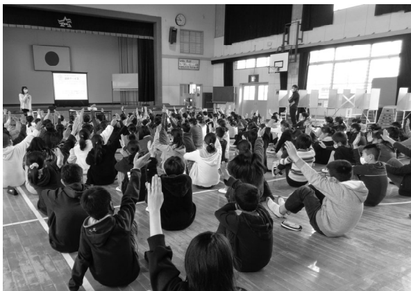
職員による講義 (塩原小学校)