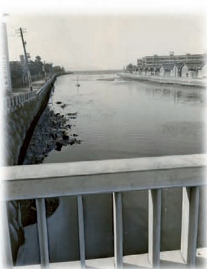
今川橋から見た河口 昭和36年