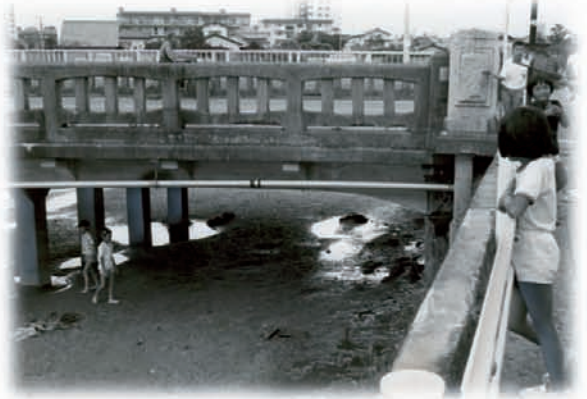
干潟で遊ぶ子供たち 昭和55年