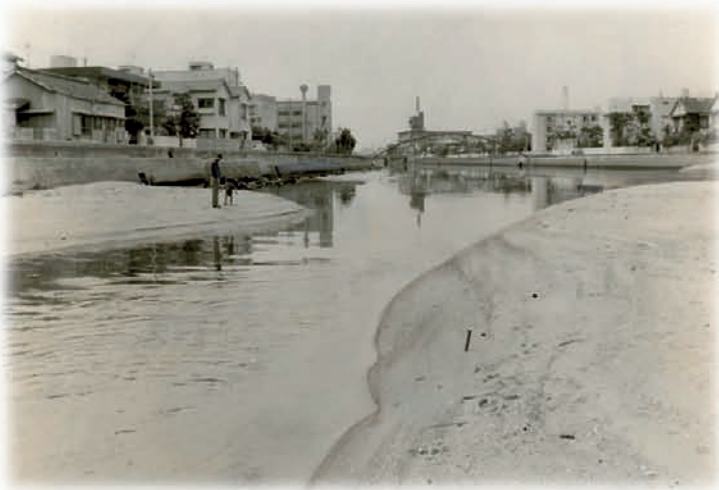
河口に土砂が堆積した樋井川 昭和49年