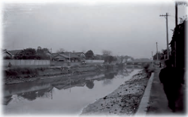
生活雑排水の流入により悪臭が漂う樋井川 昭和35年