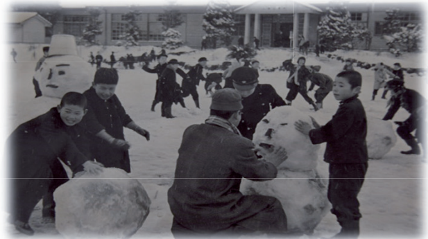
入部小学校 雪の中の新学期 昭和31年