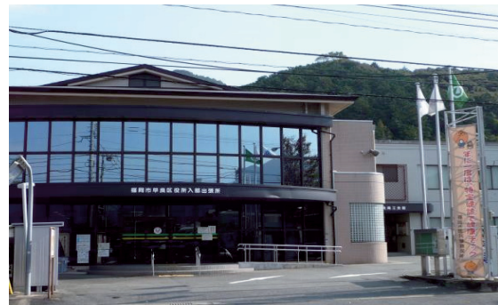
現早良区入部出張所