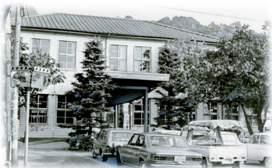
旧入部村役場★ 昭和45年

その後、昭和50年3月1日に福岡市に合併編入され、早良郡は歴史の幕を閉じました。