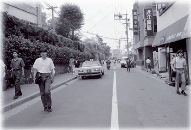
片側歩道の西新通り・昭和60年

「サザエさん通り」は、早良区の脇山立交差点から、シーサイドももち海浜公園入口までの道路約1.6キロの通りです。