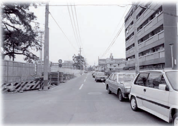
西新通り線の拡幅工事・昭和62年