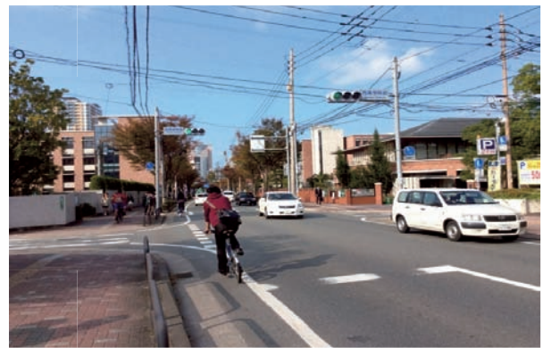
西南クロスプラザ付近・現在