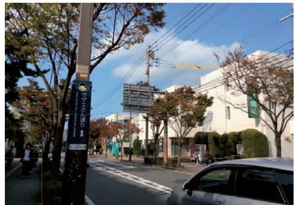
修猷館高校付近・現在