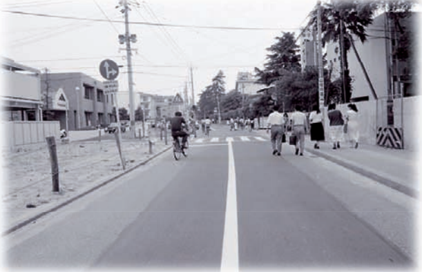
西新通り線の拡幅工事・昭和62年