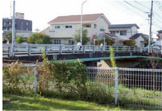
昭和50年に架け替えられた現在の徳摩橋