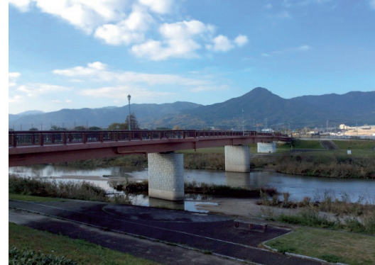
現在の河原橋 次郎丸3丁目