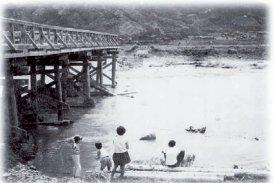
河原橋(室見川) 昭和38年 昭和38年水害により橋の半分が流出