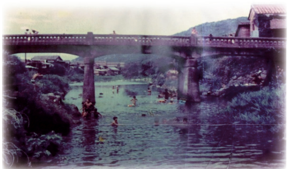
内野大橋(八丁川) 昭和36年