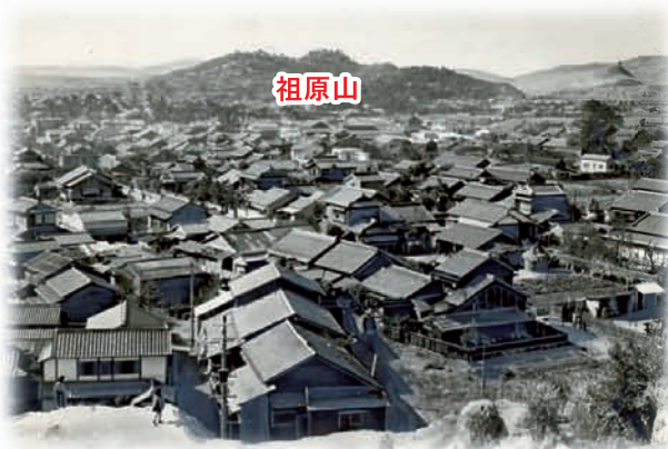
紅葉山から見た高取の町並み・昭和31年