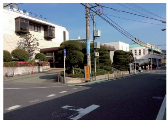
西新病院の後にできた成人病センター