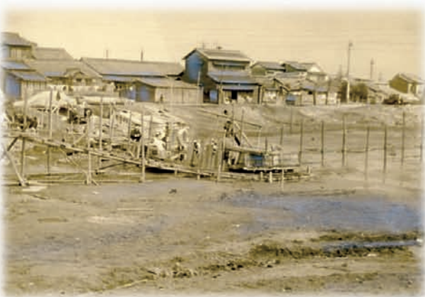
西新病院の建設地麓原池の埋め立て★ 昭和33年