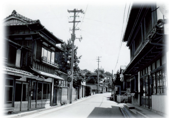
紅葉神社付近の通り 昭和52年