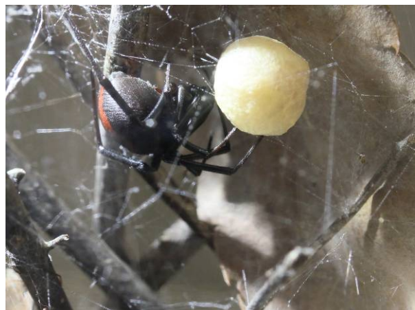
図3 飼育中のメスが産んだ卵のう