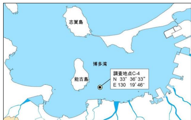
図 1 調査地点図

博多湾中部海域の C-4 地点を調査地点とし、表層水を試料としてサンプリングした。サンプリングは平成 25 年 10 月 17 日に行った。調査地点を図 1 に示す。