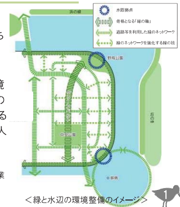
<緑と水辺の環境整備のイメージ>

※アイランドシティを「市民の貴重な財産」とするために、新しい「みなとづくり」「まちづくり」に全力をあげて、かつスピード感を持って取り組んでいくための事業方針として策定