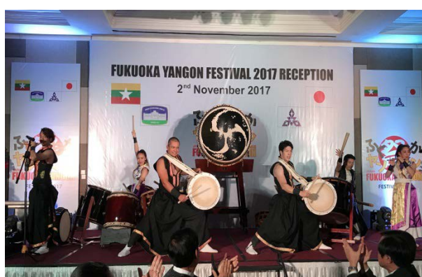
福岡の和楽団ジャパンマーベラスの和太鼓演奏

(左から) ゴー・ミン・ウィン・ミャンマー商工会議所連盟会頭，マウン・マウン・ソー・ヤンゴン市長，高島福岡市長，丸山在ミャンマー日本国大使館公使参事官，唐澤 JICA ミャンマー事務所長