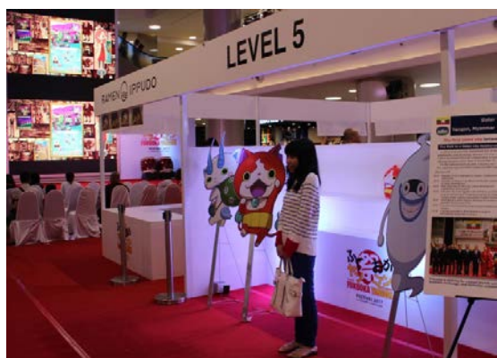
ゲーム・アニメPRブース （レベルファイブ）