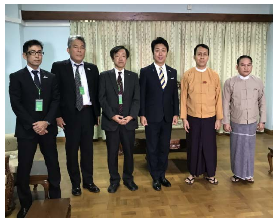
福岡市長・福岡市議会事務局長による ヤンゴン地域政府首相等表敬訪問