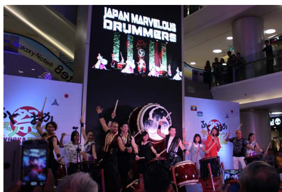
ジャパンマーベラスの和太鼓演奏，ヤンゴン市民の演奏体験