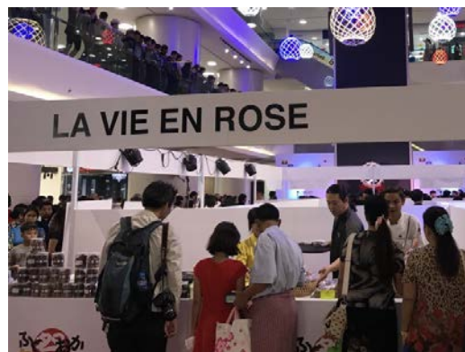
福岡のラ・ヴィ・アン・ローズによる 洋菓子ブース