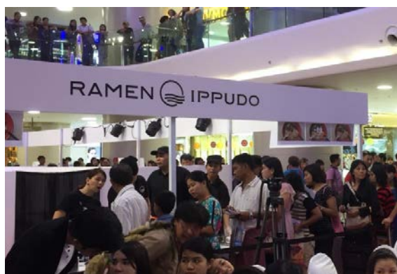
博多ラーメンPRブース（一風堂）