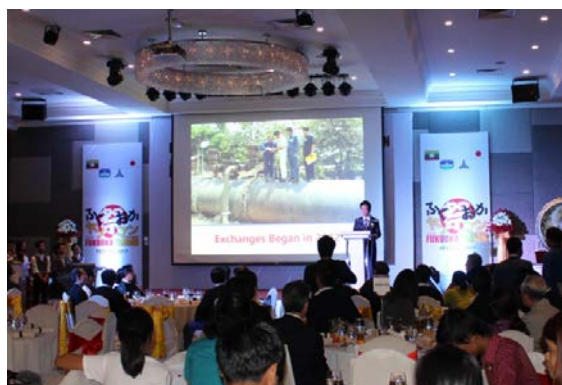
福岡市プレゼンテーション