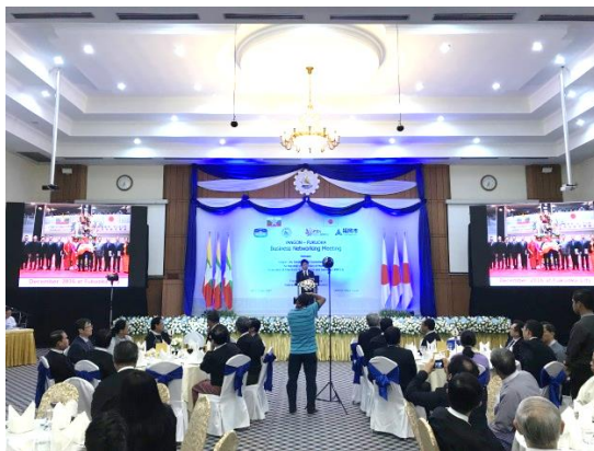
福岡市プレゼンテーション