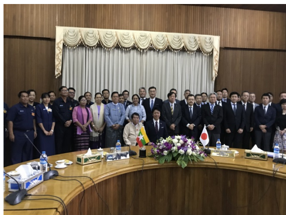
福岡経済訪問団によるヤンゴン市役所 （YCDC）表敬訪問