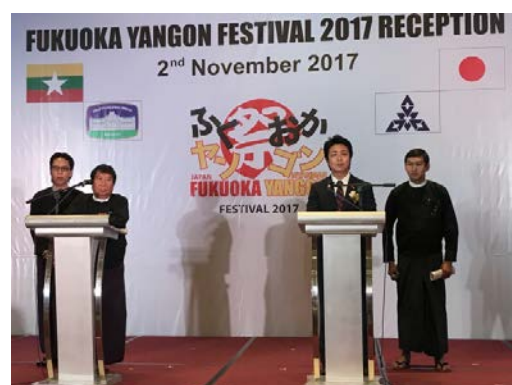
両市長共同記者会見