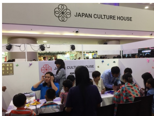
日本伝統文化体験ブース （ジャパンカルチャーハウス）