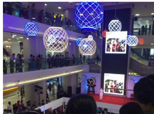
46 万人の SNS フォロワーを持つ人気インフルエンサーのトークショー（福岡観光体験の紹介）