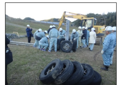
過去の実地研修の様子

③ 専門研修では、上記実地研修の他、 福岡方式の特色や構造についての講義 、 浸出水処理や発生ガス分析についての実習 、 ヤンゴン市における福岡方式埋立場整備に向けた勉強会等 を実施します。（研修期間：7 月 31 日～8 月 8 日）