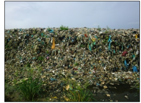
ヤンゴン市テインピン埋立場（平成 29 年 7 月）