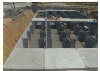
プレキャスト雨水貯留施設

✚ JICA 中小企業支援メニュー (参考 URL : http://www.jica.go.jp/sme_support/ )