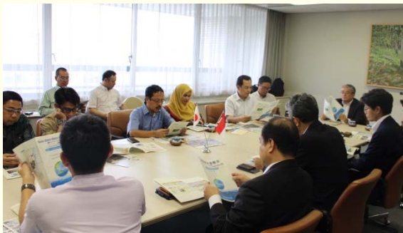
マカッサル市職員による福岡市役所訪問 (H29.7.3) ～福岡市の浸水対策概要を説明～

同社製品の導入による、インドネシア共和国における水害への対応力強化、安全で安心な防災、災害対策の実施を目指すもの。