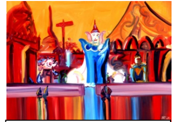
ニェインチャンスー 《シュエダゴン・パゴダの壇上》1998年