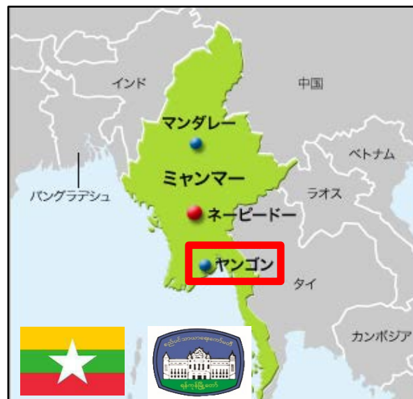
ミャンマー国旗 ヤンゴン市旗