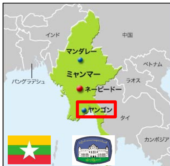
ミャンマー国旗 ヤンゴン市旗