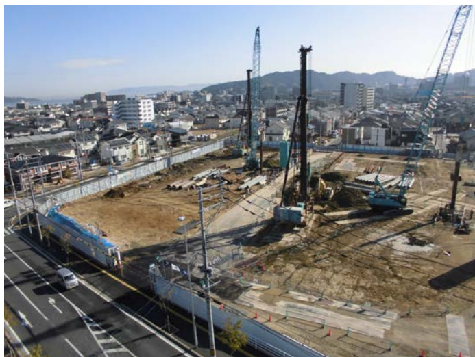
校舎側（敷地北側）全景（西側から撮影）