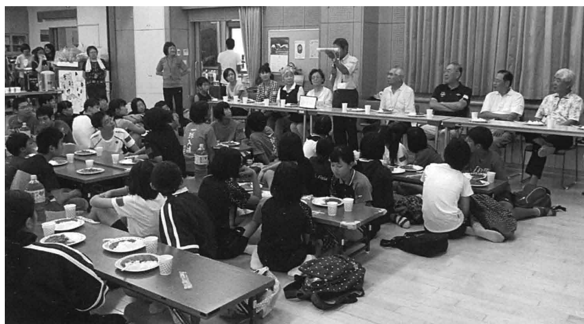
交流会 地域の方と一緒に 美味しいカレーの 昼食を食べました