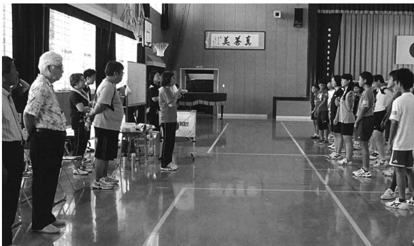
開会式 青育連会長あいさつ