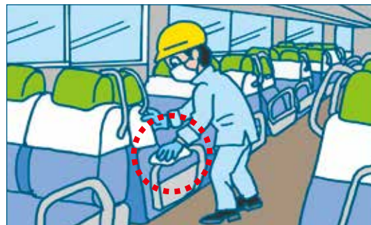
でんしゃてしょうどく 電車のイスの手すりを消毒