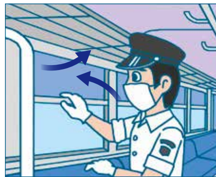
でんしゃまどあかんき 電車の窓を開けて換気